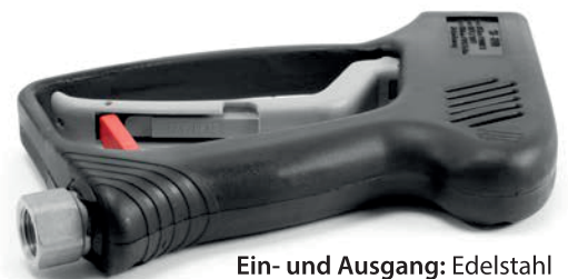
Ein- und Ausgang: Edelstahl

Innere Werte: Hochwertige Materialien für beste Chemiebeständigkeit. R+M Nr. 202 000 054 auch für ST-2000 und ST-601 einsetzbar.