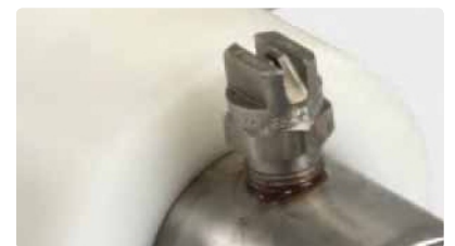
Auf Achse: Flachstrahldüsen für Ihre Anforderungen einsetzbar.