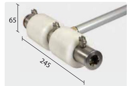
Spitze: Leichtgängig durch POM-Kunststoffrollen, Durchmesser: 60 mm.

Optimal erreichbar: Ganz ohne Hebebühne. Vom Boden her sauber!