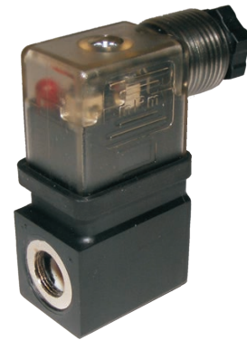
ROE 720006 + ROE 702806