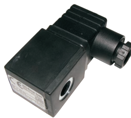
ROE 730101 / ROE 730102