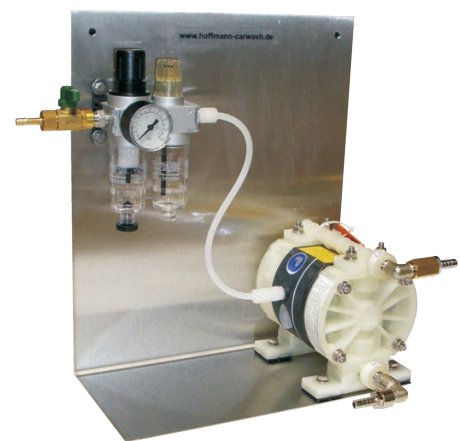
YP NDP5 W